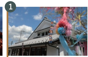
1 岸本家住宅主屋 (登録有形文化財)