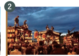
2 幸手の夏まつり (山車の勢ぞろい)