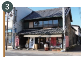
3 永文商店・横丁鉄道 (荷捌き用の現役トロッコ)