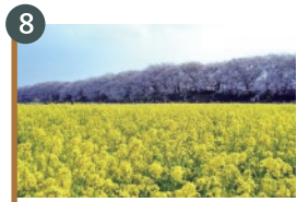
8 権現堂さくら堤 (さくらと菜の花)