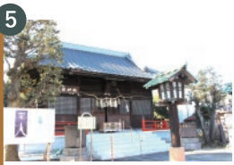
5 幸宮神社 (総鎮守・市指定文化財)