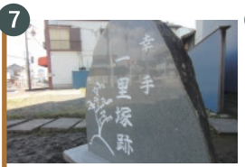
7 幸手一里塚跡の碑 (江戸から12里)