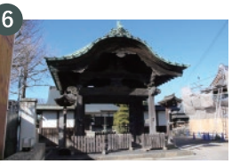
6 聖福寺勅使門 (市指定文化財)